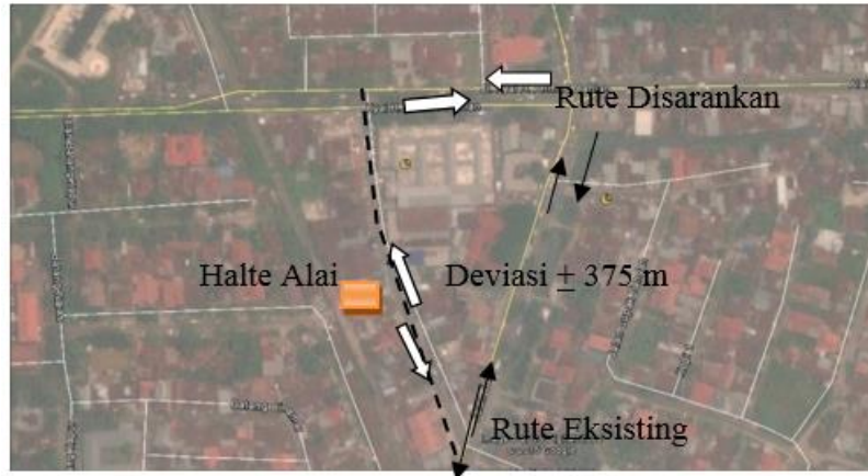
Gambar 3. Deviasi Rute melewati Halte Alai