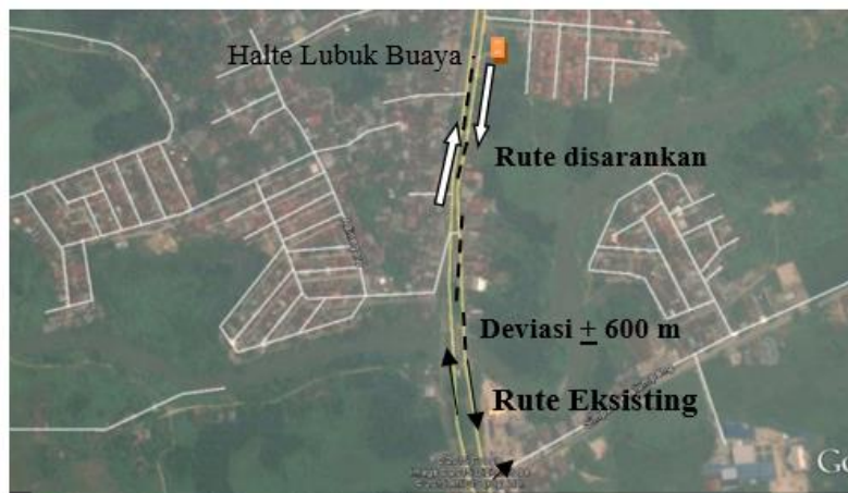
Gambar 4. Deviasi Rute melewati Halte Lubuk Buaya