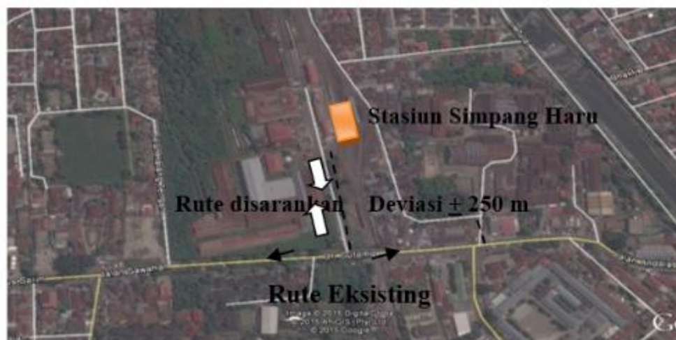
Gambar 2. Deviasi Rute melewati Stasiun Simpang Haru